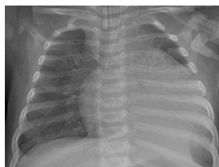
Röntgenbild von einem drei Monate alten, beatmeten Kind mit Myokarditis. Links ist das Herz massiv vergrößert.

Wir fördern die Etablierung einer einheitlichen Diagnostik bei Kindern und Jugendlichen mit dem Verdacht auf Myokarditis. Daher unterstützen sie das MYKKE-Register, das am Deutschen Herzzentrum Berlin geführt wird. Seit 2013 sammeln die Berliner Herzspezialisten gemeinsam mit 22 weiteren Zentren in Deutschland Daten zu Diagnostik und Therapie bei Myokarditis im Kindes- und Jugendalter. So entsteht eine Forschungsplattform, die es er-