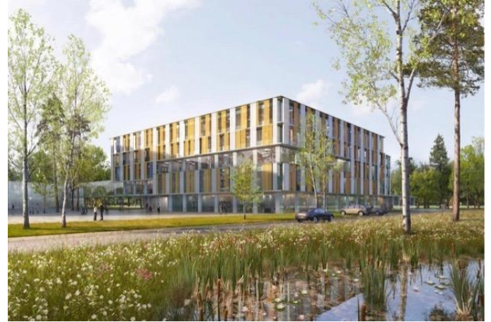
Zurzeit entsteht das neue Eltern-Kind-Zentrum des Universitätsklinikums Bonn. Es soll 2018 eröffnet werden. Hier ein Modell.