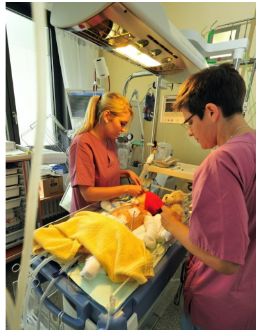
Wärmestrahler verhindern ein Auskühlen der kleinen Patienten.

Übrigens waren die Wärmestrahler für die Kinderherzabteilung des ELKI längst vorgesehen. Doch die Kosten für ein so großes Bauvorhaben müssen verantwortungsvoll geplant werden. Das Budget ist endlich. Die Wärmestrahler wurden zugunsten des Monitorings auf der Kinderintensivstation eingespart. Die kinderherzen möchten beides ermöglichen.